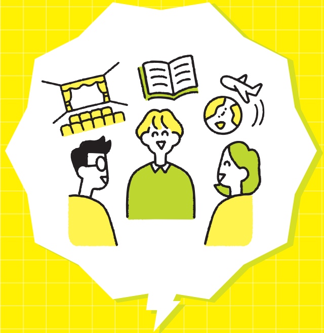
経験と知識の共有