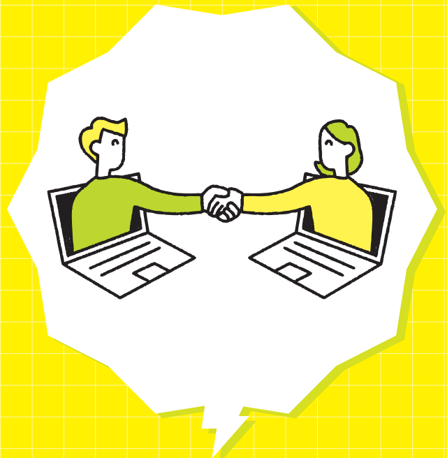
メンティーは全国から参加 オンラインでつながるネットワーク