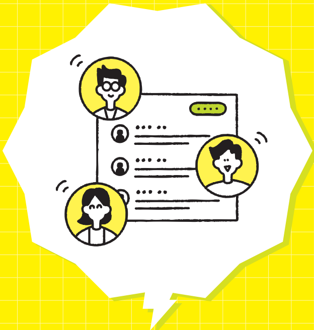
対話・意見交換の プラットフォーム