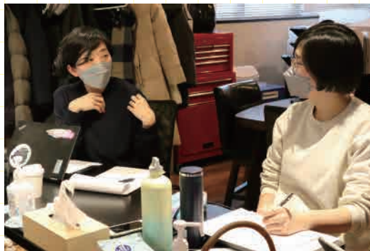
ファーストピッチの様子

ファーストピッチ以降、メンターとメンティーが集まって対話をする最初の場。メンティーからはこの期間中に取り組んだ活動の内容が報告され、メンターからはメンティーの課題意識や、それに対してフィードバックした知見などを共有しました。制作者としての活動のビジョン、中長期の目標、そのための施策（課題・解決方法・メンターとの関わり方）などがまとめられた「ファーストピッチ用のワークシート」を振り返りながら、今後の動きを確認していきました。