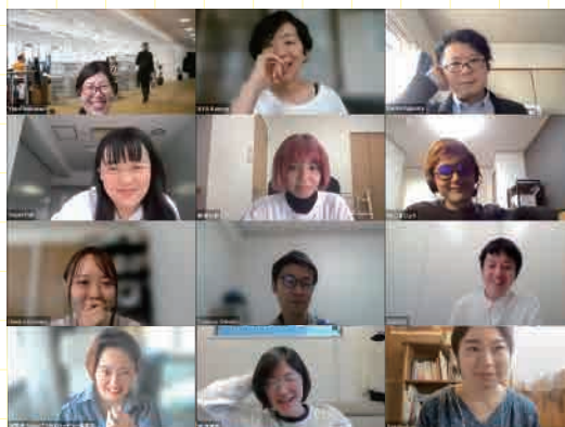
中間報告会の様子

第1回に続き、4カ月ぶりとなる報告会。メンティーからはこの期間中に自身の活動において更新された点や、メンタリングのなかで話し合っている課題や、アドバイスなどが共有されました。前回と異なった点は、ディスカッションの時間が設けられたことです。ディスカッションのテーマは「ハラスメント」「ギャラの設定」の2つ。ふだんのメンタリングでも対話をしてきた問題意識が、メンバー全員でのやり取りによってより多様な視点が交換された、充実した内容になりました。