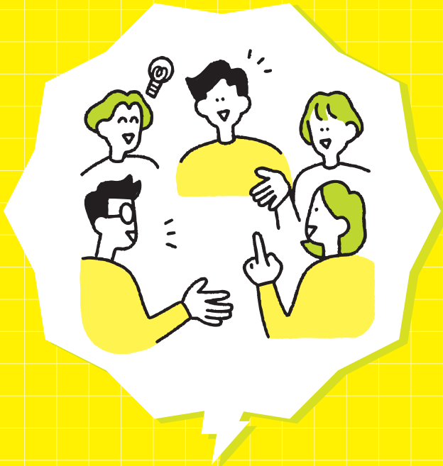
メンティー同士の交流も