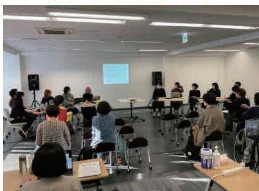
ラストピッチの様子

4回の公開レクチャーを終えてひらかれた第3回。今回は、各講座のなかで印象に残った言葉を振り返りながら、対話をする場面もありました。メンティーからは期間中に直面した課題も共有され、「メンタリングがなかったらどこに相談できていたろうか？」という問いは、これからのバッテリーや情報共有の方法を考えるきっかけになりました。ディスカッションでは「組織とフリーランス」「他者との関わり方」というテーマについて、具体例をもちよりながら話し合い、ラストピッチにつなげました。